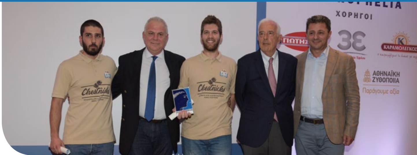
Οι νικητές του Εθνικού Διαγωνισμού ECOTROPHELIA.

Με ιδιαίτερη επιτυχία πραγματοποιήθηκε την Τρίτη, 26 Ιουνίου, στην Αίγλη Ζαπείου, ο Εθνικός Διαγωνισμός Οικολογικών - Καινοτόμων Προϊόντων Διατροφής ECOTROPHELIA 2018. Νικητές του Διαγωνισμού, που διοργανώνει τα τελευταία 8 χρόνια ο Σύνδεσμος Ελληνικών Βιομηχανιών Τροφίμων, αναδείχθηκαν και πάλι η δημιουργική νέα γενιά και η καινοτομία!