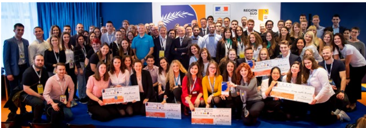
Οι ομάδες που συμμετείχαν στον Ευρωπαϊκό Διαγωνισμό ECOTROPHELIA 2018.