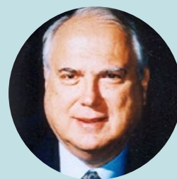
Μηνάς Τάνες Γενικός Γραμματέας